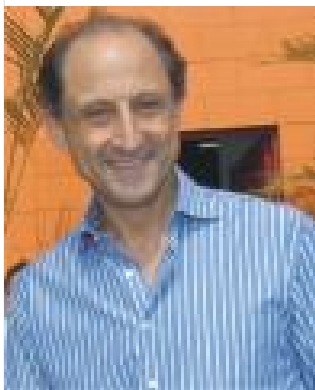
Paulo Skaf voltará a unificar a presidência do Ciesp e Fiesp

Na sede, a chapa eleita foi encabeçada pelo atual presidente da Federação das Indústrias do Estado de São Paulo - Fiesp, Paulo Skaf. Ele foi reeleito para a Fiesp e com a eleição para presidente do Ciesp, volta a unificar a presidência das duas entidades.