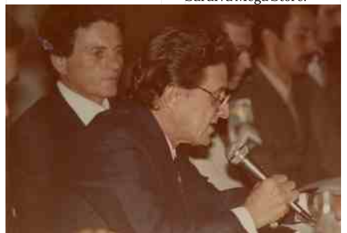
Varga no início das atividades do Ciesp Limeira

O livro é uma referência e ensinamento aos empreendedores. Ele está disponível para aquisição no Ciesp Limeira e nas livrarias da cidade e rede Saraiva Mega Store.